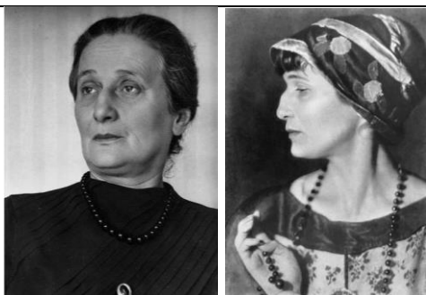
На фото одна и та же поэтесса.