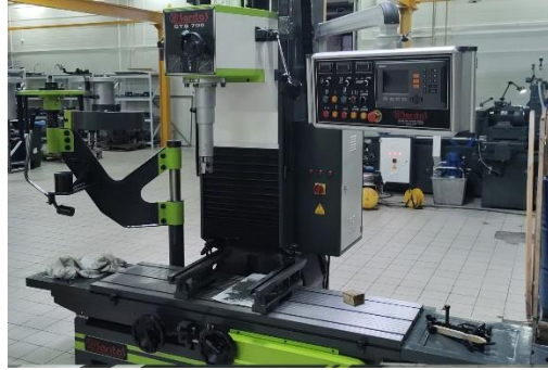
STS 700 - вертикально-расточной станок с ЧПУ для блоков цилиндров