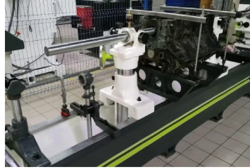
STS 2250 - горизонтально-расточной станок для обработки постелей