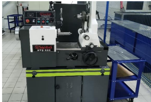
STS 600 – станок для ремонта шатунов любых двигателей