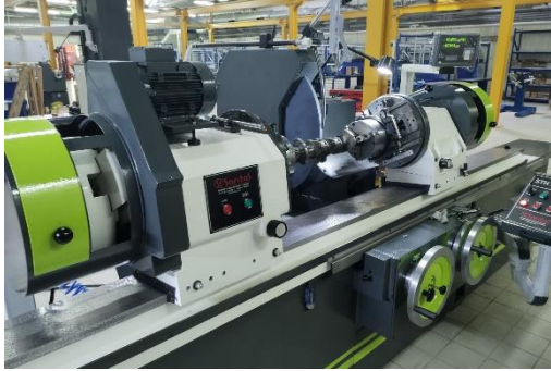
STH 2200 - шлифовальный станок для обработки коленчатых валов