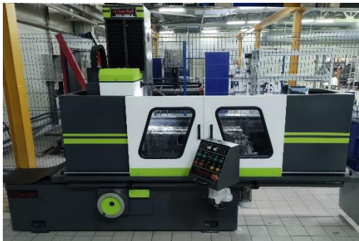
STH 1600 - станок для шлифования и фрезерования плоскости поверхностей