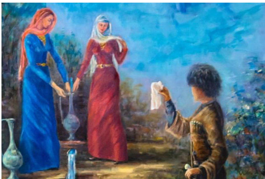
Иллюстрация: У родника / Д.Товсултанов

Праздник весны — особый праздник для чеченцев. Этот день встречали до рассвета и выходили во двор, навстречу восходящему солнцу. Все медное в доме начищалось до блеска и символизировало солнце. Днем же было принято делить достаток с нуждающимися. Вечером разжигали большие костры, огонь которых символизировал очищение и приход весны.