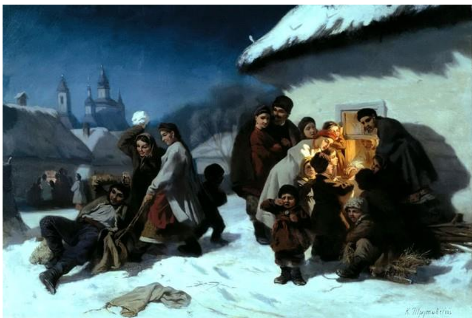
Иллюстрация: Колядки в Малороссии / К. А Трутовский

Самый любимый праздник украинцев — Рождество. Рассказывал и воспевал его не один классик. А рассказывать о нем было что, ведь сами рождественские гуляния продолжались почти две недели, и каждый их день был особым и невероятным отголоском народно-драматического творчества украинцев. Рождественские гуляния проходили в атмосфере счастья, добра и достатка.