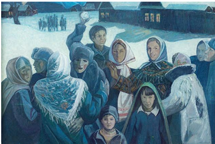
Иллюстрация: Сурхури / К.В. Владимиров

Сурхури — старинный чувашский праздник периода зимнего солнцестояния. Особую роль в празднике занимали увеселения, тайны, игры, гадания и песни. Молодые люди поздравляли соседей с наступившим новым годом и собирали от них подарки, которые потом служили особым обрядовым инвентарем, который относили в специально отведенный дом или баню. Веселье длилось до самого утра.