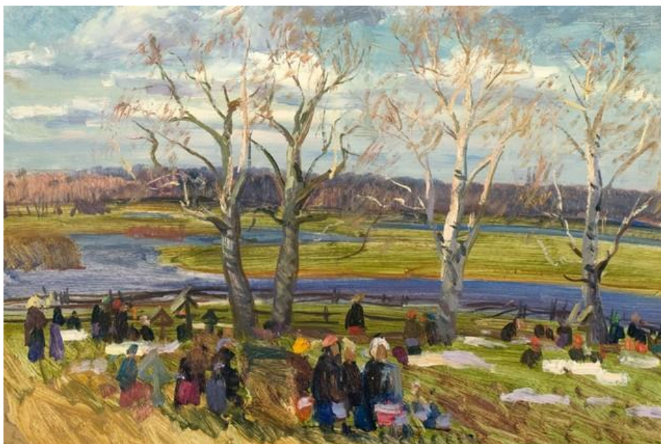
Иллюстрация: Радоница / Ф.С. Шурпин

Радоница — один из древнейших праздников, который особо чтут белорусы. В этот день принято вспоминать и чтить своих предков, а также углубляться в свои корни, и историю. Ритуальный обед готовится только женщинами, причем количество блюд всегда строго нечетное. Подаяние складывается в большой полотняный платок, который разрешается развязывать только мужчинам.