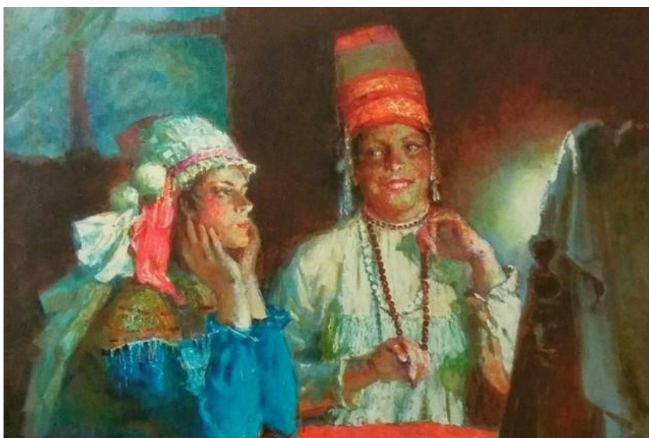
Иллюстрация: Святочные гадания / М.С. Шанин

Роштувань куд — один из самых веселых мордовских национальных праздников. Его праздновали зимой. Центром гуляний считался специально выделяемый новогодний дом, где проходили массовые гуляния и обряды. Особое внимание во время праздника уделялось одежде. Считалось, что чем ярче и красочнее будут наряды, тем счастливее и богаче проживут наступивший год люди.