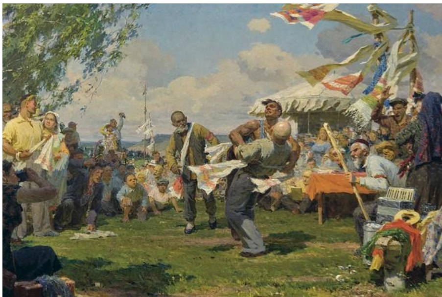
Иллюстрация: Сабантуй / Л.А. Фаттахов

Сабантуй — главный национальный праздник у татар и башкир. Он символизирует окончание посевных работ и ожидание богатого урожая. Готовятся к нему всегда заранее: девушки готовят подарки, сделанные своими руками; а уже перед началом праздника, молодые парни собирают их для будущих победителей игр и состязаний. Сабантуй всегда отмечают громко, весело и задорно.