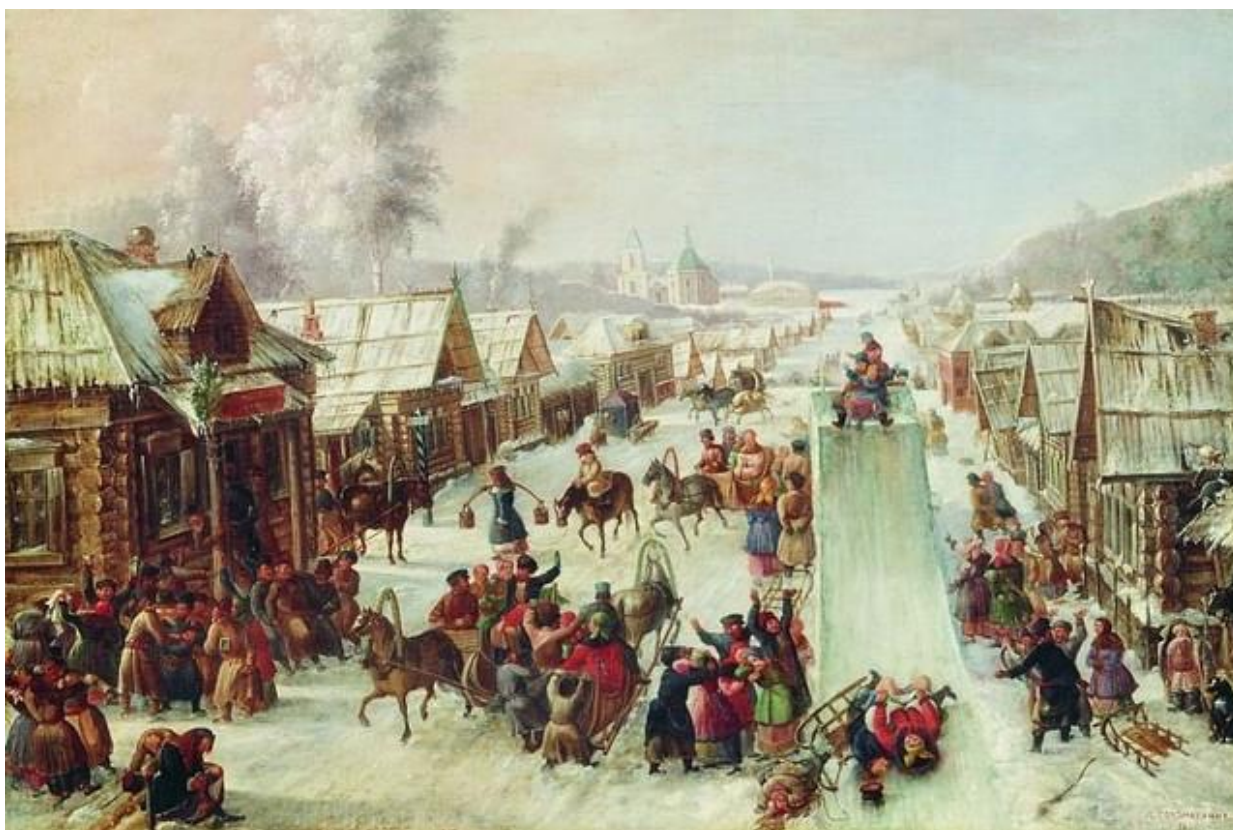
Иллюстрация: Масленица / Л. И. Соломаткин

Масленица — самый яркий, веселый и зрелищный русский праздник, на котором провожают зиму и встречают такую долгожданную весну. Неотъемлемый атрибут праздника — чучело Масленицы, блины, лепешки, вареники, шумные гуляния и забавы на открытом воздухе. Традиционно Масленица длится целую неделю, а каждый ее день — это особое торжество, которое посвящено брачным обрядам.